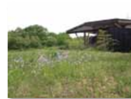
자연관 옥상 녹화