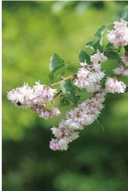
サラサウツギ (アジサイ科)

駐車場・南エントランス 八重咲きのウツギで、花が桃色の 大変美しい品種です。園内各所に 植えられており、5～6月のシン ボルとも言えるでしょう。