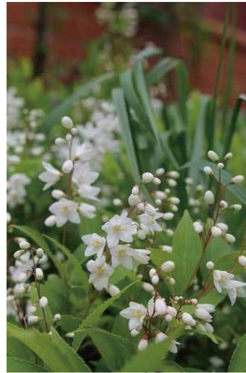
ヒメウツギ (アジサイ科)

自然館前 自然館を囲うように白の花園が広 がっています。花を一つとってじっ くり見てみましょう。可愛い雄し べが並んでいます。