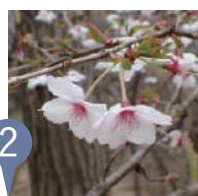
② マメザクラ (豆桜) Cerasus incisa

4月上旬から中旬にかけて開花。葉が展開してから咲くことと、花の色や開花時期などに個体変異が大きいのが特徴です。葉柄や花柄の一部などに毛のあるウスゲヤマザクラと呼ばれる個体も時折見られます。