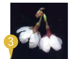
③ タマノホシザクラ (多摩の星桜) Cerasus tamaclivorum

3月下旬から4月上旬に開花する早咲きの桜。ガクが赤く尖り、花を後ろから見ると星形をしています。2004年に大原隆明氏(現富山県立植物園)他により発表された新しい種で、エドヒガンとマメザクラの遺伝子を併せ持つ雑種起源の桜と考えられています。