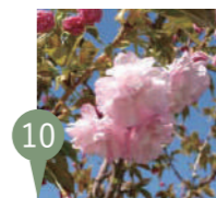
⑩ コウカ (紅華)