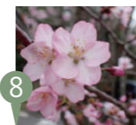
⑧ オオヤマザクラ (大山桜) Cerasus sargentii

葉の展開と同時に開花し白色で大型、良い香りの花を咲かせるのが特徴です。大きな葉は桜餅を包むのに利用されます。やまざと広場を中心に植栽されています。4月上旬～中旬にかけて開花します。