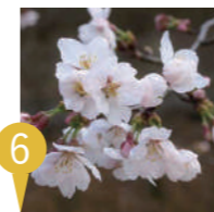
⑥ ソメイヨシノ (染井吉野) Cerasus × yedoensis 'Somei-yoshino'