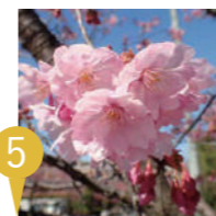
⑤ ヨウコウ (陽光) Cerasus 'Youkou'

オオシマザクラとエドヒガンを交配して作られたアマギヨシノを片親に、愛媛県の桜栽培家である高岡正明氏がカンヒザクラを交配して作り出した栽培品種です。開花は3月下旬から4月上旬に開花します。