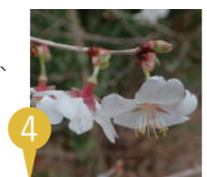
④ ヤブザクラ (藪桜) Cerasus hisauchiana