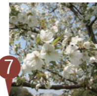
⑦ オオシマザクラ (大島桜) Cerasus speciosa

エドヒガンとオオシマザクラの自然雑種で生まれた桜です。この桜の登場は江戸時代後期、染井(現在の葛飾区)の植木屋が見出したとされ、それ以降に広まってきました。3月下旬～4月上旬にかけて開花します。