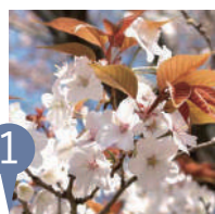
① ヤマザクラ (山桜) Cerasus jamasakura

4月上旬から中旬にかけて開花。葉が展開してから咲くことと、花の色や開花時期などに個体変異が大きいのが特徴です。葉柄や花柄の一部などに毛のあるウスゲヤマザクラと呼ばれる個体も時折見られます。