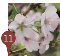
⑪ ゴテンバザクラ (御殿場桜) Cerasus incisa 'Gotenba-zakura'