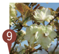
⑨ ウコン (鬱金) Cerasus serrulata 'Grandi flora'