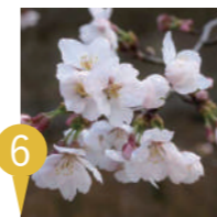
⑥ ソメイヨシノ (染井吉野) Cerasus × yedoensis 'Somei-yoshino'