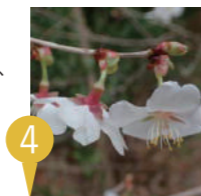
④ ヤブザクラ (藪桜) Cerasus hisauchiana