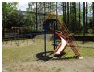
滑り台とブランコ