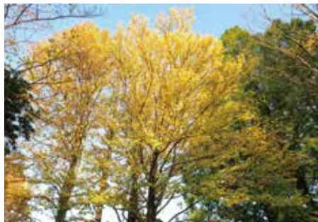
鮮やかなカツラの紅葉 (秋)

かつてこの辺りからお伊勢参りへ向かう人々を見送ったことから、「伊勢参り」という地名が残されたと言われています。