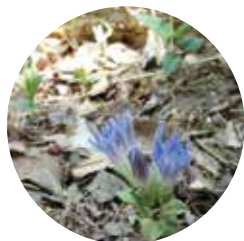
足元にひっそりと咲くフデリンドウ (春)

公園のシンボルでもあるメタセコイア並木。円形に植えられた並木の中に立つと、別世界にきたような不思議な雰囲気があります。