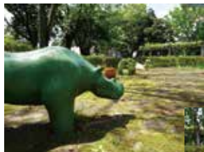
砂場の中でらみ合うライオンとカバ。それを見守るサイとリスとラクダ