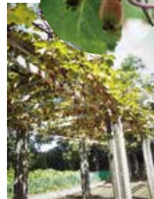
藤棚ならぬキウイ棚