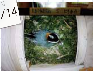
⑦卵をあたためています。