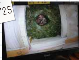
⑧全部で6羽のヒナが孵りました。