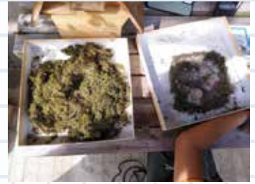
巣箱から取り出したヤマガラ(左)とシジュウカラ(右)の巣