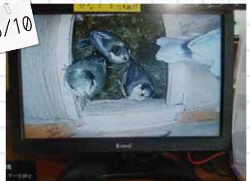
⑩すべてのヒナが巣立ちました。