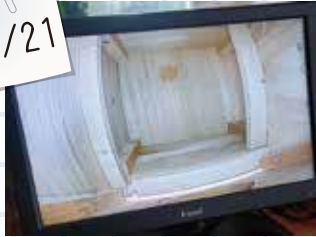
①巣箱を設置しました。