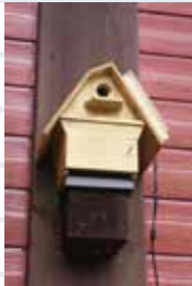
自然館に設置した巣箱

3月21日、自然館から駐車場にかけて全部で4基の巣箱を設置し、うち2つにはシジュウカラ、1つにはヤマガラが入ってくれました。ヤマガラの巣箱には内部にカメラが仕込んであり、中の様子を館内のモニターで常時観察できるようにしました。