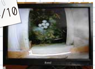
⑥産卵が完了しました。