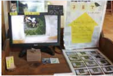
自然館内の観察モニター