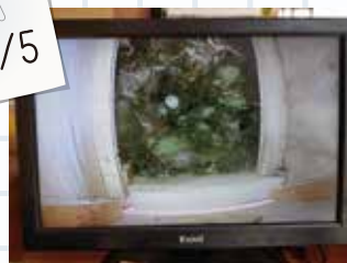
⑤産卵が始まりました。