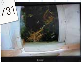
④杉の樹皮を剥いで使っています。