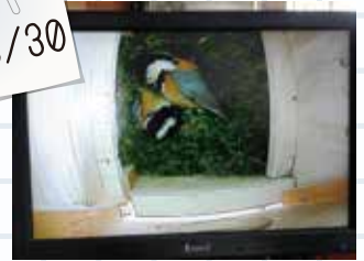
③侵入者との闘いの様子です。