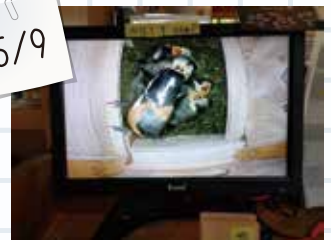
⑨すすくと育っています。

卵から孵った6羽のヒナは、多くの来館者に見守られながら、すすくと成長。そして、5月10日の14時頃、ヒナたちは無事に巣立っていきました。ちょっと寂しくもありますが、これから先、たくましく生きていってほしいですね。「ヤマガラさん、貴重な生態を覗かせてくれてありがとう!」