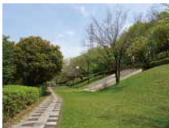
開放的な園内と大きなコンクリート滑り台