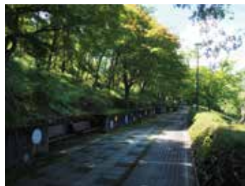
上段は樹林の残る落ち着いた空間