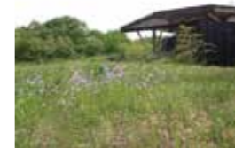
自然館の屋上緑化